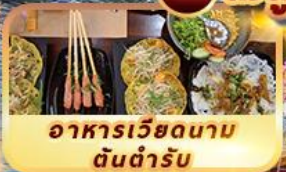
อาหารเวียดนาม ต้นตำรับ