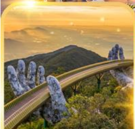
สะพานมือยักษ์