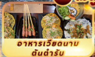
อาหารเวียดนาม ต้นตำรับ