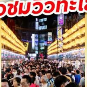
โด่งไนท์มาร์เก็ต