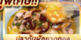
ปลาต้มผักกาดดอง