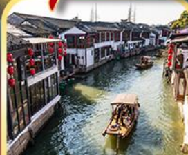
เมืองโบราณซูเจียเจียว