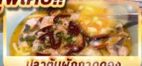
ปลาต้มพริกทอดดอง