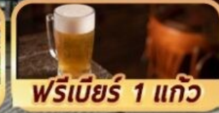
ฟรีเบียร์ 1 แก้ว