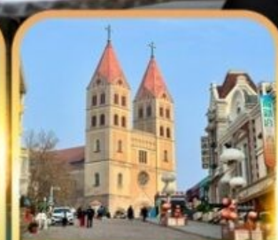
โบสถ์เซ็นต์ไมเคิล