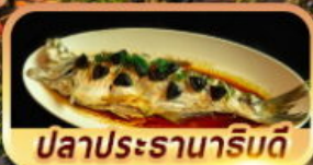
ปลาประรานาภิรมดี