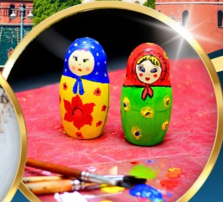
• MATRYOSHKA PAINTING •