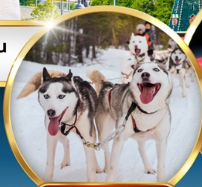
• SAAMI VILLAGE •