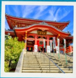
Osu Kannon Temple