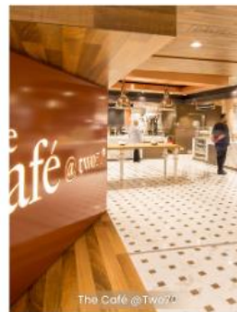
The Cafe @ Two70 CAFE 270