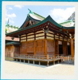
Imamiya Ebisu Shrine