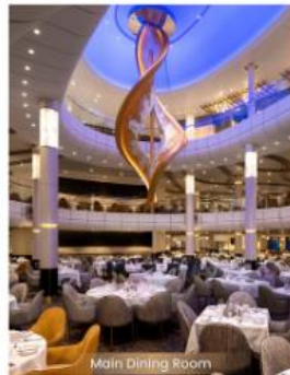
Main Dining Room MAIN DINING ROOM