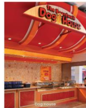
Dog House DOG HOUSE