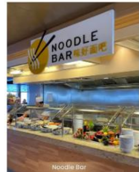
Noodle Bar NOODLE BAR