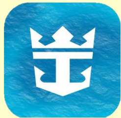
Royal Caribbean International App.

- โหลดแอป Royal Caribbean ไว้ในมือถือ เพื่อลงทะเบียน และ โหลดตั๋วเรือสำราญ