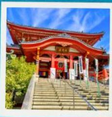
Osu Kannon Temple