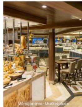
Windjammer Marketplace WINDJAMMER