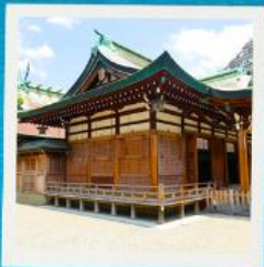
Imamiya Ebisu Shrine