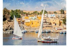
Option ล่องเรือเฟลกะ หรือ ล่องเรือชมหมู่บ้าน Nubian Village

** พักที่ Royal Beau Rivage Nile cruise 5* หรือเทียบเท่า **