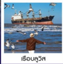
เรือบลูวิส