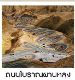
ถนนโบราณผานหลง