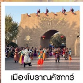
เมืองโบราณคัชการ