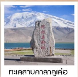
ทะเลสาบกาลากูเล่อ