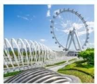
สวนสาธารณะ OH BAY