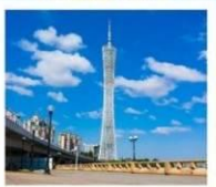
จัตุรัสฮั่วเจียง