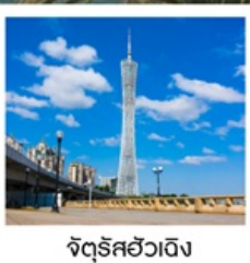
จัตุรัสฮัวเจิง