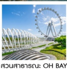
สวนสาธารณะ: OH BAY