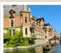
เวนิสแห่งต้าเหลียน