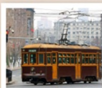
นั่งรถรางชมเมืองต้าเหลียน