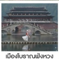
เมืองโบราณฟังหวง