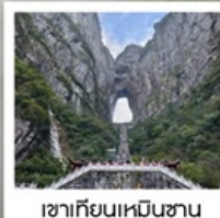
เขากียนเหมินซาน