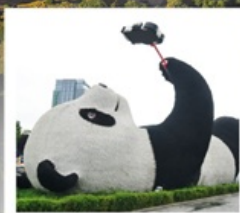
รูปปั้นแพนด้าเซลมี่