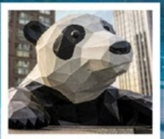
ห้าง IFS แพนด้าป็นตึก

จัดทริปหย่างเก๋ยนวู / รูปปั้นหมีแพนด้าเซลฟี / เมืองโบราณกัวนเซี่ยน คำธารสีฟ้า / อุทยานภูเขาสี่ดรุณี / อุทยานชวงเฉียวโกว (รวมรถอุทยาน) อุทยานปี้ผิงโกว (รวมรถอุทยาน + รถแบตเตอรี่) / อุทยานจิวจ้ายโกว (รวมรถเหมา) ถนนคนเดินซุนชี่ลู่ / ห้าง IFS แพนด้าป็นตึก / ถนนคนเดินไท่กู่หลี่ ถนนคนเดินชอยกว้างแคบ (POP MART)