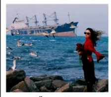
เรือควิวส

หอคอยกาลเวลา / รูปปั้นปลาวาฬ / ถนนโบราณเตาหยาง / ย่านสงโขว่ 1920 / เมืองเว่ยไห่ / ถนนฮั่วจวีปา / จตุรัสประตูแห่งความสุข ย่านอันลอฟาง / เรือควิวส / หาดซาจื่อโซ่ว / ถนนหลงเจียง / สะพานจันเจียว / หาดไซเบอร์ No. 3 ถนนจงซาน / โบสถ์ St.Emill / จตุรัส 54 / ศูนย์เรือใบโอลิมปิก / พิพิธภัณฑ์เบียร์ชิงเต่า / ถนนโตตง / ท่าเรือประมงเหยียนโก๋