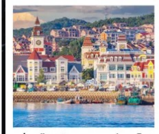
ท่าเรือประมงเหยียนโก๋