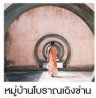
หมู่บ้านโบราณเฉิงชาน