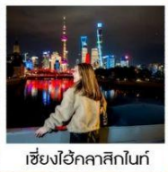
เซี่ยงไฮ้คลาสสิกไนท์