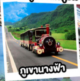
ภูเขาฉางฟ้า