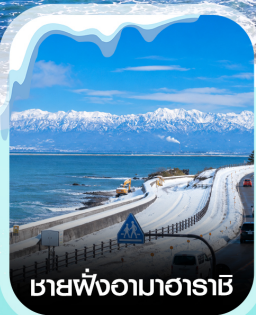
เขายั้งอามาฮาระชิ