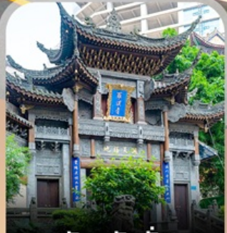
วัดหลิวอัน