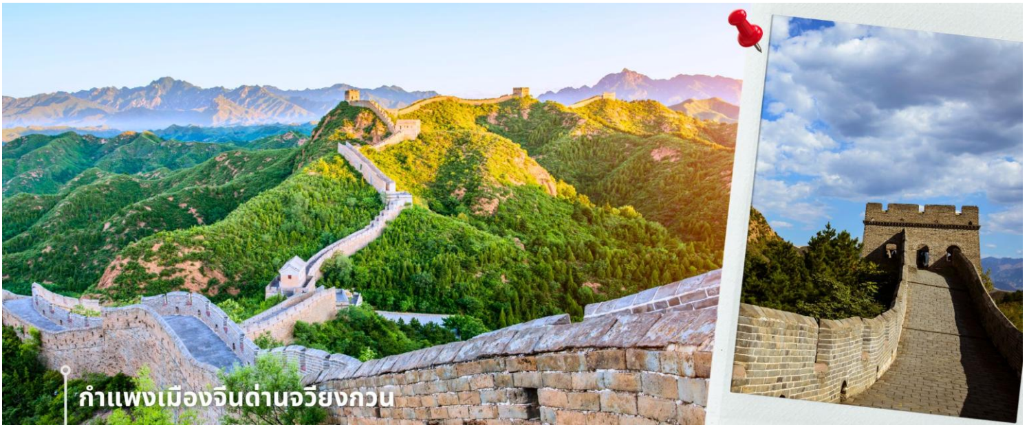
กำแพงเมืองจีนด้านจิวหยงกวน

กรุงปักกิ่งมีการรุกรานจากชนเผ่าเร่ร่อน ด้านจิวหยงกวนมีสถาปัตยกรรมที่สวยงามของศิลปะจีน จากยอดดงด้าน สามารถมองเห็นทิวทัศน์ที่สวยงามของเทือกเขาและธรรมชาติโดยรอบ นับว่าเป็น 1 ใน 8 จุดชมวิวที่มีชื่อเสียงของปักกิ่งมาตั้งแต่สมัยราชวงศ์ฉิน