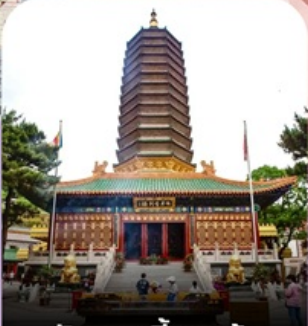
วัดพระเขี้ยวแก้ว