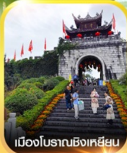
เมืองโบราณซิงเหยียน

✈️ คอนเฟิร์มออกเดินทาง ✈️ ทุกพีเรียด 2 ท่านขึ้นไป