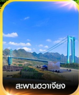
สะพานฮวาเจียง