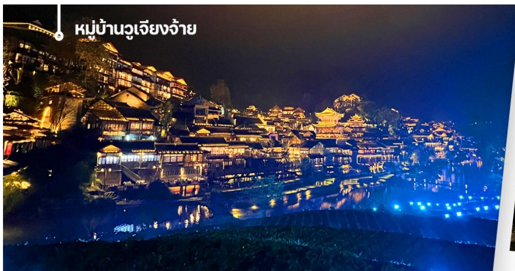
หมู่บ้านวูเจียงจ้าย

จากนั้นนำท่านเดินทางสู่หมู่บ้านวูเจียงจ้าย (Wujiang Zhai) เป็นหมู่บ้านโบราณในมณฑลกุ้ยโจว ประเทศจีน ที่มีความสำคัญทางวัฒนธรรมและเป็นที่ตั้งถิ่นฐานของชนเผ่าต้งและชนเผ่าม้ง หมู่บ้านแห่งนี้ตั้งอยู่ในหุบเขากลางที่รายล้อม