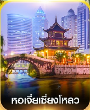
หอเจียเซียงโหลว