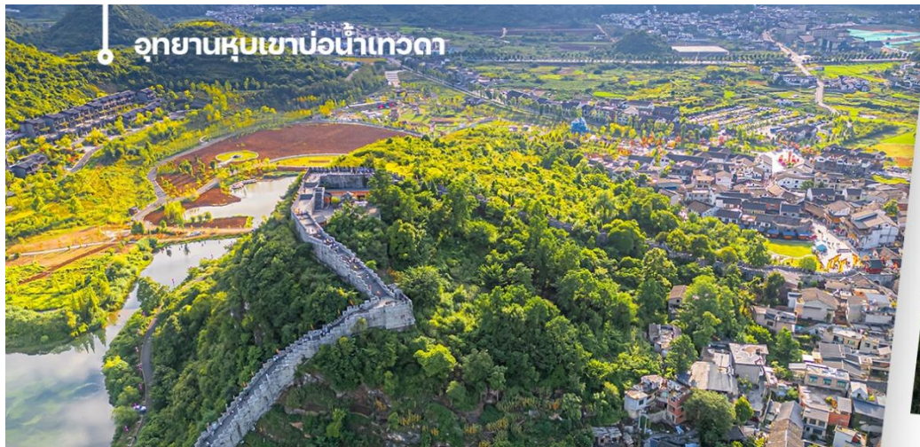
อุทยานหุบเขาบ่อน้ำเทวดา

นำท่านเดินทางไป อุทยานหุบเขาบ่อน้ำเทวดา หรือ หุบเขาเสินฉวน (รวมรถแบริดเตอร์) เป็นแหล่งท่องเที่ยวที่คุณจะได้สัมผัสกับธรรมชาติ ให้ท่านได้ใช้คอนิที่จุดชมวิวหุบเขาเสินฉวน ตั้งอยู่ท่ามกลางธรรมชาติที่อุดมสมบูรณ์สวยงามในเขตปกครองตนเองชนกลุ่มน้อยเผ่าเหมียวและปู้อี ฉีเยินหนาน ดึงดูดให้นักท่องเที่ยวผู้ชื่นชอบธรรมชาติจากทั่วทุกสารทิศอยากจะมาเยือนหุบเขาแห่งนี้ (รวมค่าขึ้นสะพาน SKYWALK ไว้ในรายการแล้ว)ให้ท่านได้เก็บภาพประทับใจได้เต็มที่