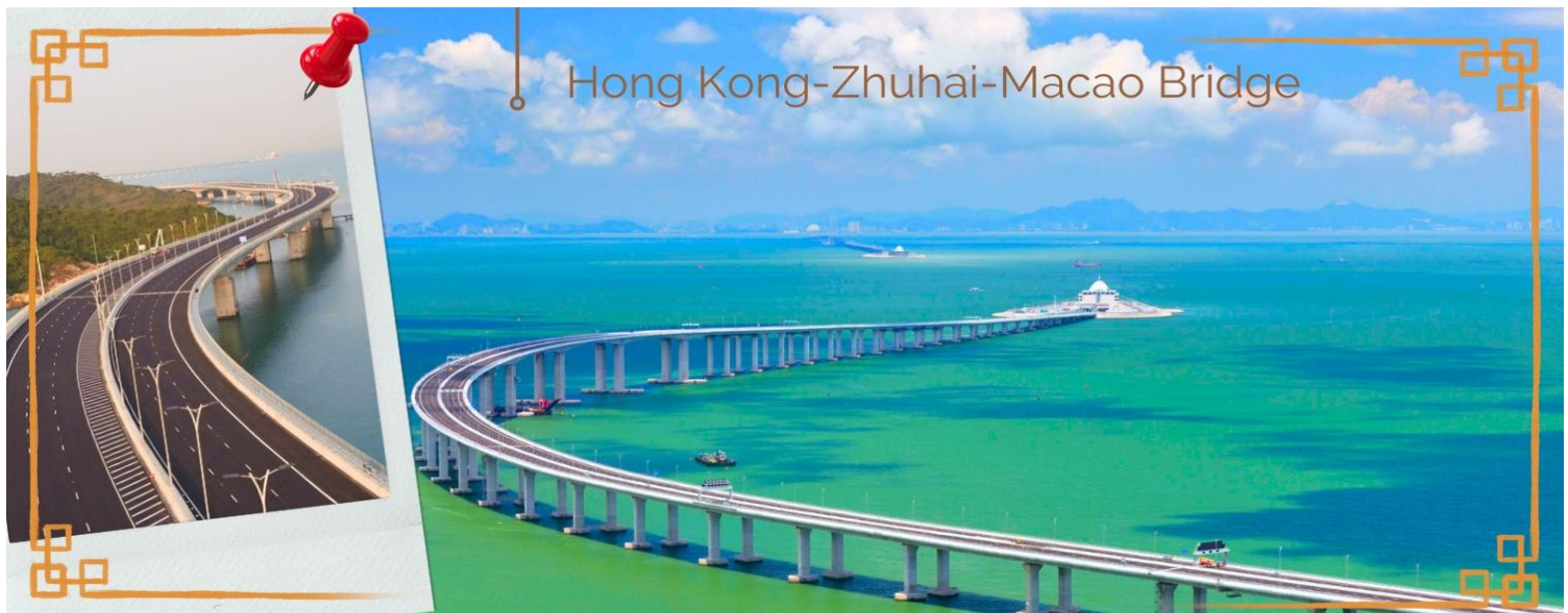
CHXH9 ฮองกง-มาเก๊าเดย์ทัวร์ เทียวจุใจ 4วัน2คืน สายการบิน Hongkong Airlines (Jun-Oct' 26)

วันสอง กรุงเทพฯ สุวรรณภูมิ- ฮองกง (สนามบินเซ็กแล็บก๊อ) - เทียวมาเก๊าแบบวันเดย์ทัวร์ ไปเช้า-กลับเย็น 02.40 น. นำท่านเดินทางสู่ ฮองกง โดยสายการบิน HONG KONG AIRLINES (HX) เที่ยวบินที่ HX768 07.00 น. เดินทางถึงสนามบินเซ็กแล็บก๊อ เขตปกครองพิเศษฮองกง นำทุกท่านเข้าพิธีการตรวจคนเข้าเมืองหลังจากผ่านพิธีการตรวจคนเข้าเมืองเป็นที่เรียบร้อยแล้ว รับกระเป๋าสัมภาระ และเดินทางโดยรถโค้ชปรับอากาศ **โปรดทราบ เวลาท้องถิ่นที่ฮองกงเร็วกว่าประเทศไทย 1 ชั่วโมง กรุณาปรับนาฬิกาให้ตรงกับเวลาท้องถิ่น เพื่อความสะดวกในการนัดเวลานะคะ** อีสระให้ท่านแวะทำธุระส่วนตัวตามอัธยาศัย หลังจากทำธุระส่วนตัวเป็นที่เรียบร้อยแล้ว นำกระเป๋าสัมภาระส่วนตัว และเดินทางโดยรถโค้ชปรับอากาศ (สัมภาระฝากไว้ที่รถ)นำท่านเดินทางสู่ มาเก๊า (MACAU) หรือ เอ้าเหมิน (รถโค้ชปรับอากาศ) ด้วยการเดินทางผ่านเส้นทางสะพาน Hong kong – Zhuhai – Macao Bridge สะพานมีความยาว 55 กิโลเมตร ซึ่งเป็นสะพานข้ามทะเลที่ยาวที่สุดในโลก สะพานดังกล่าวเปิดใช้งาน เมื่อวันที่ 23 ต.ค. 2561 ซึ่งเชื่อมระหว่างเขตบริหารพิเศษฮองกง กับเมืองจูไห่ของมณฑลกวางตุ้ง และเขตบริหารพิเศษมาเก๊าของจีน โดยสะพานเส้นทางนี้นับเป็นครั้งแรก ที่จะช่วยลดระยะเวลาการเดินทางจากฮองกงไปยังจูไห่และมาเก๊า จากเดิม 3 ชั่วโมง ให้เหลือเพียงภายใน 1 ชั่วโมง มาเก๊า มีชื่อทางการว่า เขตบริหารพิเศษมาเก๊าแห่งสาธารณรัฐประชาชนจีน เป็นพื้นที่บนชายฝั่งทางใต้ของประเทศจีน เป็นเขตปกครองพิเศษของจีน โดยมีฐานะเป็น เขตบริหารพิเศษภายใต้หลักการ หนึ่งประเทศสองระบบ ผู้ที่อาศัยอยู่ในมาเก๊าส่วนใหญ่พูดภาษากวางตุ้งเป็นภาษาแม่ ภาษาจีนกลาง ภาษาโปรตุเกส และภาษาอังกฤษ ชาวมาเก๊า มี