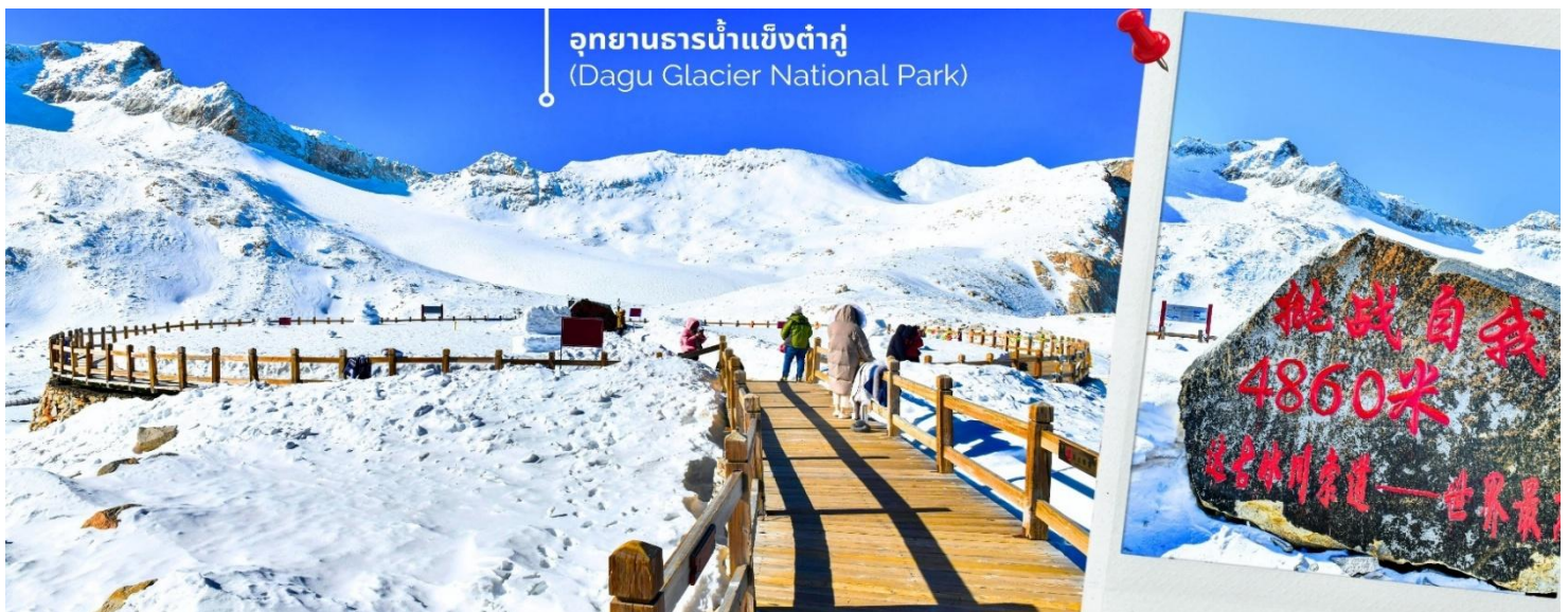
ความหนาวของหิมะขึ้นอยู่กับสภาพอากาศ

จากนั้นนำท่านเดินทางสู่ เมืองเฮยลู่ย (ใช้เวลาเดินทางประมาณ 2 ชั่วโมง) เพื่อเดินทางไปยัง อุทยานธารน้ำแข็งต้ากู่ (รวมกระเช้าขึ้นลง) ต้ากู่ปิงชวน หรือ Dagu Glacier National Park เป็นธารน้ำแข็งกลาเซียร์ที่สวยงามที่สุดแห่งหนึ่งของโลกและเป็นสถานที่ท่องเที่ยวระดับ 4A ของจีน ตั้งอยู่ที่เมืองเฮยลู่ย ในมณฑลเสฉวน ห่างจากเมืองเฉิงตู ประมาณ 300 กิโลเมตร ถือเป็นธารน้ำแข็งที่อายุน้อยที่สุด ที่ตั้งอยู่ในระดับความสูงที่ต่ำที่สุดและอยู่ใกล้กับเมืองมากที่สุด ในบรรดาธารน้ำแข็งทั้งหมด โดยอยู่สูงจากระดับน้ำทะเลประมาณ 3,800-5,100 เมตร จุดสูงที่สุดที่นักท่องเที่ยวสามารถขึ้นไปได้จะอยู่ที่ 4,860 เมตร