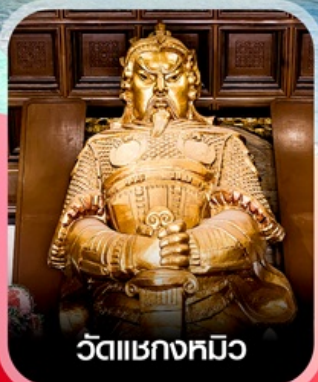
วัดแซงทมิว