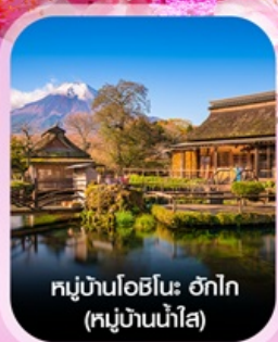
หมู่บ้านโอฮิโนะ ฮากาอิ (หมู่บ้านน้ำใส)