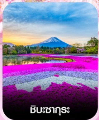
ซิบะซากุระ