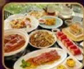
อาหารจีน ดีไซน์