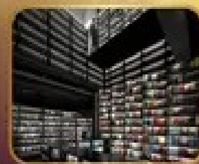
ชมร้านหนังสือ