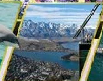
ยอดเขานิวซีแลนด์