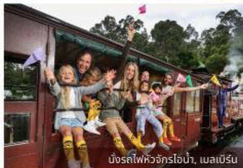
มิ่งรถไฟหิวจักรไอน้ำ, เมลเบิร์น