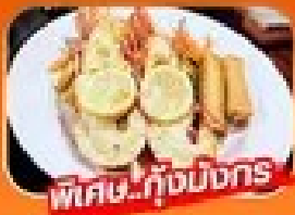
พิเศษ! กุ้งมังกร