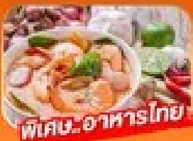
พิเศษ! อาหารไทย