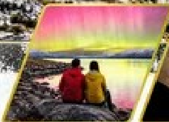
ตามล่าหาแสงใต้