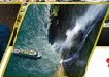
ล่องเรือมิลฟอร์ด ซาวน์