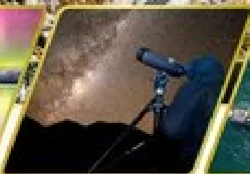
กิจกรรมชมทิวทัศน์ดาว