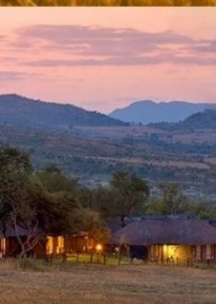
พัก SAFARI LODGE