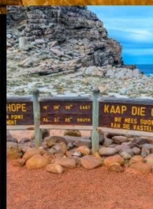
Cape good hope