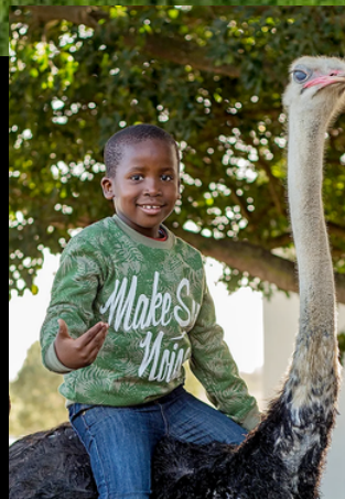
ฟาร์มนกกระจอกเทศ