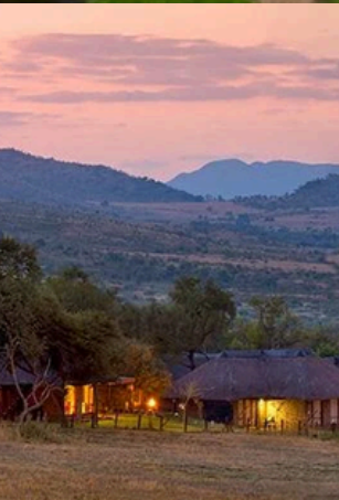
พัก SAFARI LODGE