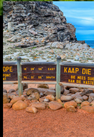
Cape good hope