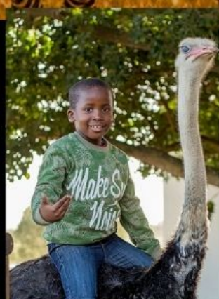
ฟาร์มนกกระจอกเทศ