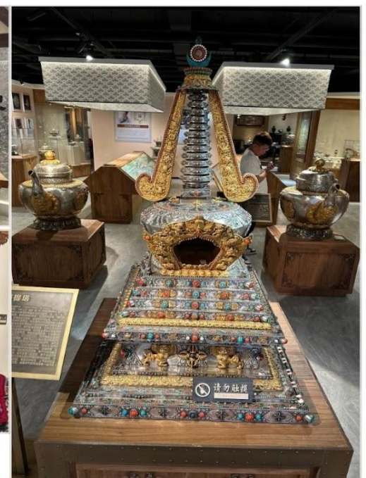
ร้านเครื่องเงินมองโกล