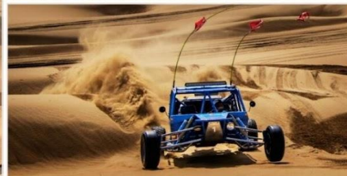
OPTION TOUR เลือกซื้อกิจกรรม สนุกสุดเหวี่ยงในทะเลทราย