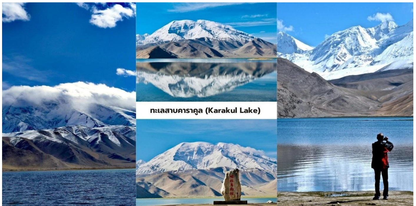
ทะเลสาบคาราคูล (Karakul Lake)

นักท่องเที่ยวสามารถเดินชมทัศนียภาพรอบทะเลสาบและสัมผัสบรรยากาศธรรมชาติของที่ราบสูงปามีร์ที่เจียบสงบ ถือเป็นหนึ่งในจุดชมวิวกูเขาหิมะและทะเลสาบที่สวยงามที่สุดของเส้นทางสายปามีร์