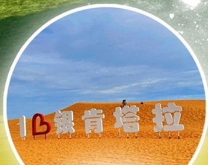
ทะเลทรายอินเคินทาลา