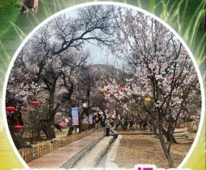
หุบเขาดอกแอปเปิ้ล

ทุ่งหญ้าซิลามูเหริน - พิธีการขอพรจากไอวเฮา - ปาร์ตี้กองไฟ - หมู่บ้านชนเผ่ามองโกล สวนวัฒนธรรมมองโกลเหมิงเสียง - หุบเขาดอกแอปเปิ้ล - ทะเลทรายอินเคินทาลา แหล่งวัฒนธรรมมองโกลหยวนหลิว (รวมรถกอล์ฟ 2 ขา) - ตลาดกลางคืนเจียไท่ สวนวัฒนธรรมการแต่งงานสุดเอ็กซ์คลูซีฟแห่งเดียวในประเทศจีน บ้านองค์ปฐม - เซตการท่องเที่ยวเจงกิสข่าน-ถนนคนเดินคังปาซือ