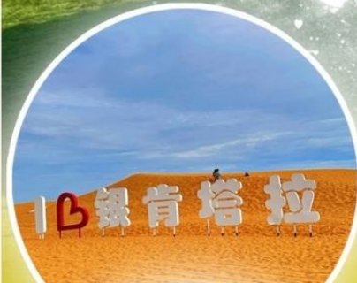
ทะเลทรายอินเคินทาลา