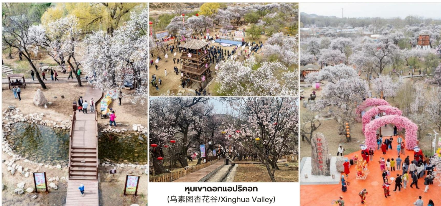
หุบเขาดอกแอปริคอต (乌素图杏花谷/Xinghua Valley)

บ่าย นำท่านชม หุบเขาดอกแอปริคอต (乌素图杏花谷/Xinghua Valley) หรือ "ชิงฮวาถู" เป็นหุบเขา ที่พื้นที่บริเวณดังกล่าวเต็มไปด้วยต้นแอปริคอต และเมื่อคราวใดก็ตามถึงช่วงเวลาที่ยอดดอกแอปริคอตเบ่งบาน หุบเขาแห่งนี้จะถูกปกคลุมไปด้วยสีชมพูหวาน จนทำให้สถานที่แห่งนี้เป็นหนึ่งในแลนด์มาร์กดึงดูดนักท่องเที่ยวให้ เดินทางไปชมภูเขาสีชมพูด้วยตาตัวเอง