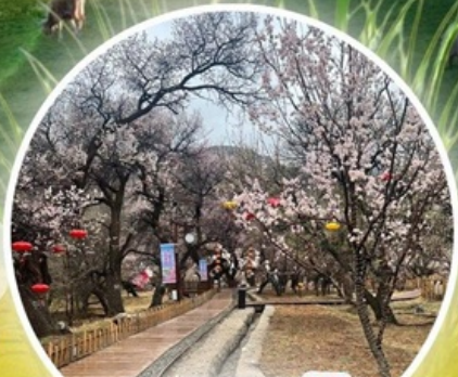
หุบเขาดอกแอปเปิ้ล

ทุ่งหญ้าซิลามูเหริน - พิธีการขอพรจากโอวเบา - ปาร์ตี้กองไฟ - หมู่บ้านชนเผ่ามองโกล สวนวัฒนธรรมมองโกลเหมิงเลียง - หุบเขาดอกแอปเปิ้ล - ทะเลทรายอินเคินทาลา แหล่งวัฒนธรรมมองโกลหยวนหลิว (รวมรถกอล์ฟ 2 ขา) - ตลาดกลางคืนเจียไต้ สวนวัฒนธรรมการแต่งงานสุดเอ็กซ์คลูซีฟแห่งเดียวในประเทศจีน บ้านองค์ปฐม - เขตการท่องเที่ยวเจงกิสข่าน-ถนนคนเดินคังปาซ้อ