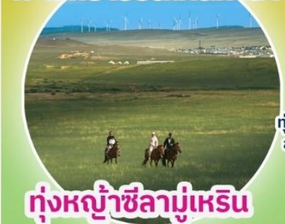
ทุ่งหญ้าซิลามูเหริน