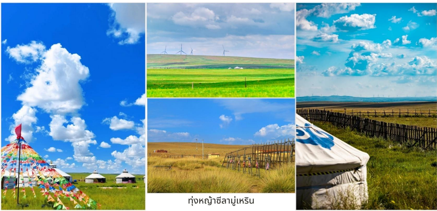
ทุ่งหญ้าซิลามูเหริน