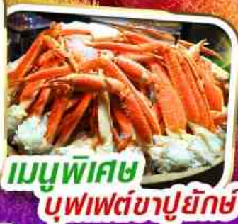
“หมู่บ้านน้ำใส โอชิโนะฮัทสึคิ”