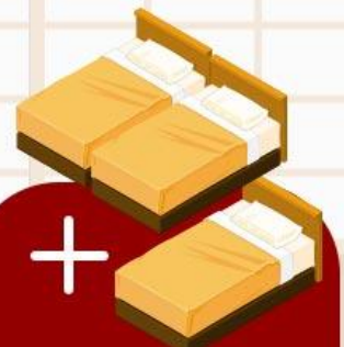
ห้องพัก 1 ห้องสำหรับ 3 คน (TRIPLE BED ROOM)

*กรณีที่บางโรงแรมไม่มีห้องประเภทนี้ ทางใดก็จะเปลี่ยนเป็นห้อง TWN แทน