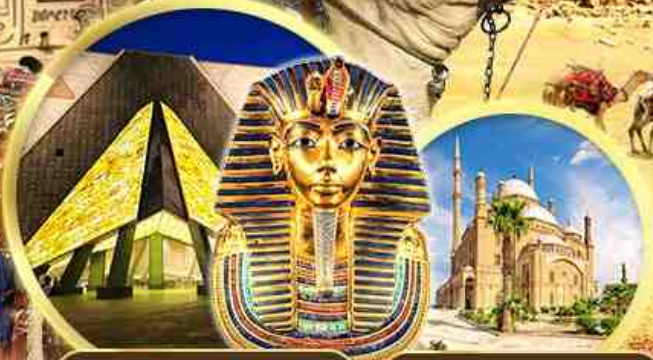
พิพิธภัณฑ์แกรนด์อียิปต์