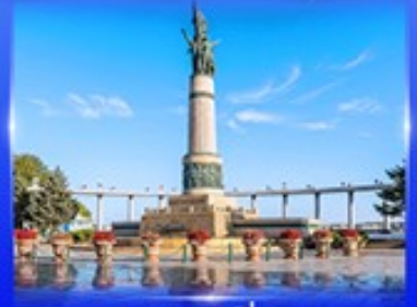
อนุสาวรีย์นิ่มหง