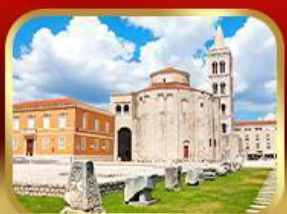
โบสถ์เซนต์โทมัส ซาการ์