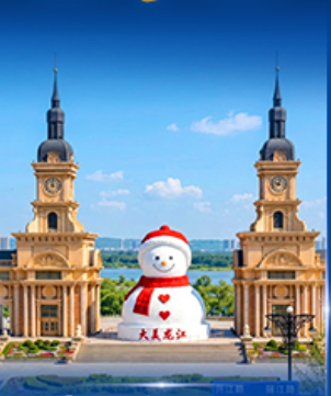
ตุ๊กตาหิมะยักษ์ ฮาร์บิน