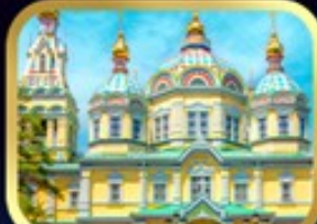
มหาวิหารเซนต์สปิริต อลมาตี