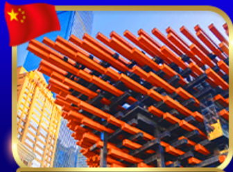
เขื่อนตักตะเกียบ