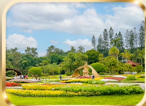
สวนบ้านปรน.เจียงไคเช็ก