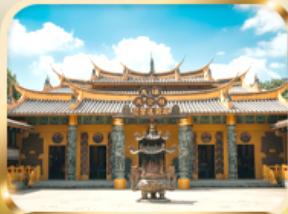
วัดต้าซี ขอความรวย