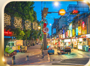
หนิงเซี่ย ไนท์มาร์เก็ต