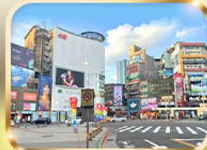
ช้อปปิ้งย่านซีเหมินติง