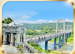
สะพานต้าซี เกาหยวน