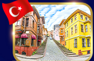
ชมบ้านหลากสี ย่านบาลีก