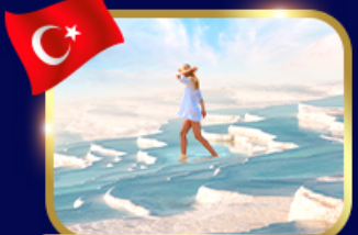
ปราสาทปูยีฝาย ปามุคคาเล่