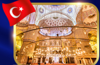
ชมความงามสุเหร่าสีน้ำเงิน

OPTION JEEP SAFARI นั่งจี๊ปชมวิวคัมปาโตเกีย