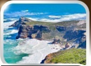
ชมวิวยามเย็นสุดแอฟริกา cape of good hope