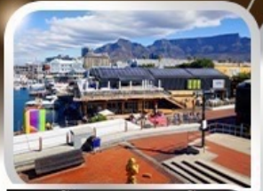
ช้อปปิ้งท่าเรือแบรนด์ชั้นนำ V&A waterfront