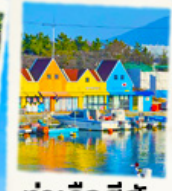
ท่าเรือสีสัน