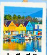
ท่าเรือสีสัน