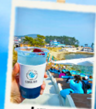
คาเฟ่ริมทะเล