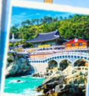
วัดริมทะเล