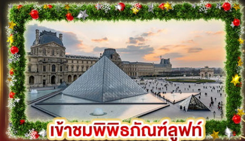
เข้าชมพีพีร์กษัตริย์