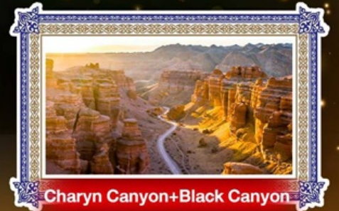
Charyn Canyon+Black Canyon