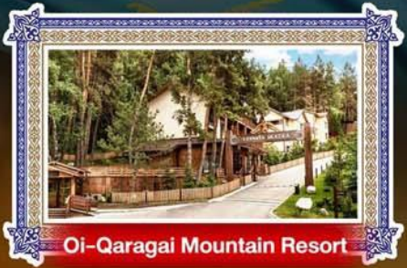
Oi-Qaragai Mountain Resort