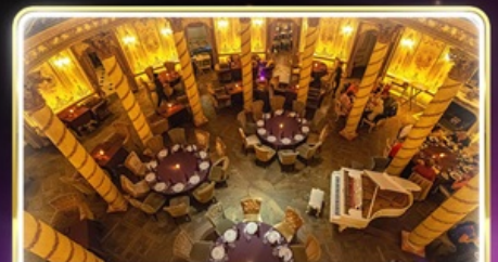
ทานอาหารสุดหรู ร้านTurandot